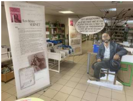
Photos de l'expo des Insurgés de 1851 dans le pays de Bourdeaux

JANVIER- FEVRIER 2022 39 ème année N° 256