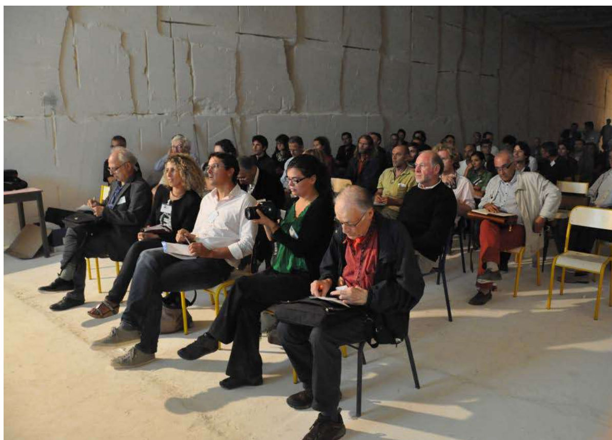
Les conférences se sont déroulées au cœur de la carrière de Sarragan.

La journée a attiré différents corps de métier et structures : architectes, tailleurs de pierre, carriers, marbriers, entreprises du patrimoine, associations en éco-construction, pôles d'entrepreneurs, centres de formation et centres techniques de conseil... Nous regrettons que les communes invitées n'aient pu être présentes, étant donné l'importance de la décision des donneurs d'ordre lors de commandes publiques et son rôle sur les constructions dans les villes. Dans les années à venir nous souhaitons également mobiliser d'avantage le secteur de l'éco-construction (entreprises spécialisées, presse). Au total, nous étions une centaine : dont 60 inscrits public plus les intervenants et les partenaires de l'association L'Apier.