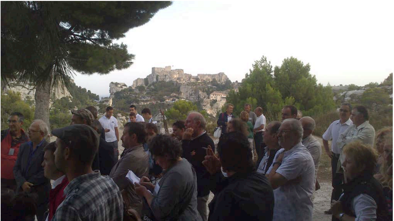
Le public de la journée professionnelle devant la construction en pierre massive posée par l'équipe du lycée professionnel Les Alpilles de Miramas durant la journée de vendredi. Esplanade de Sarragan.