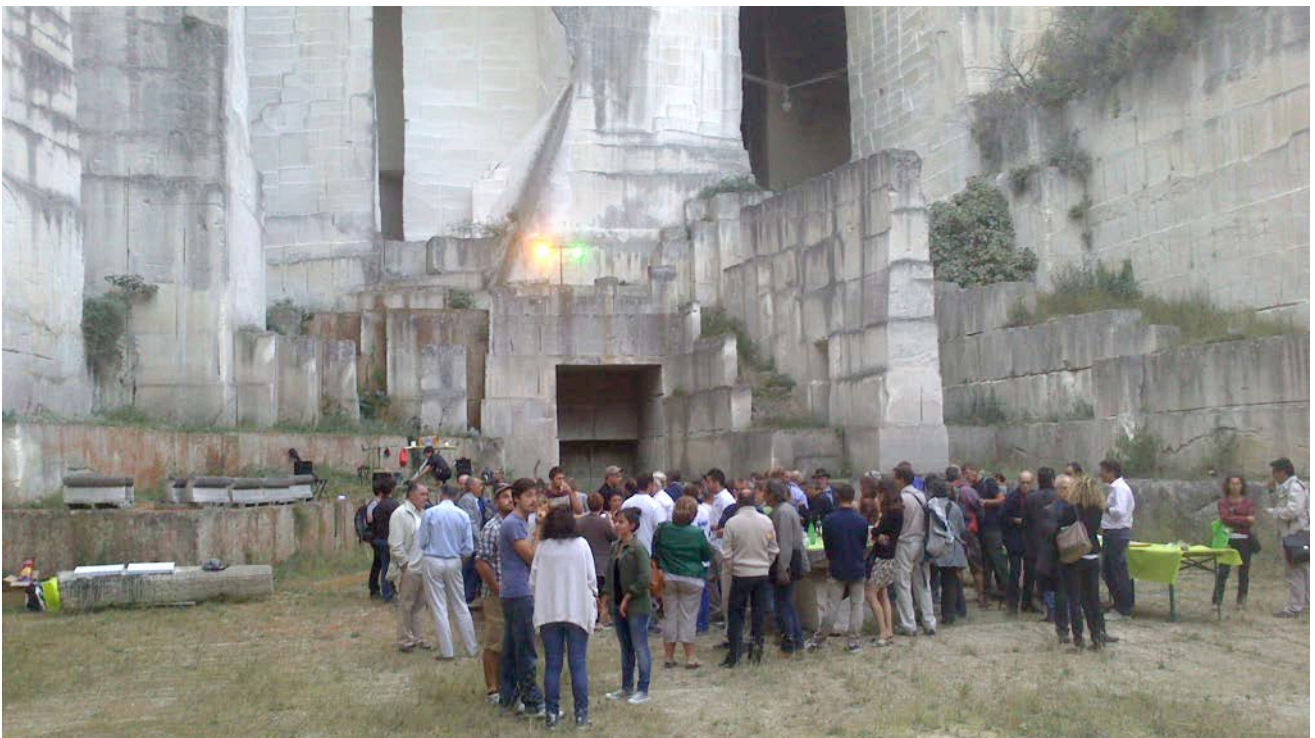
Apéritif de clôture dans la cour de la carrière de Sarragan.

Compte rendu rédigé par Sophie Piot (Conseil en patrimoine architectural)