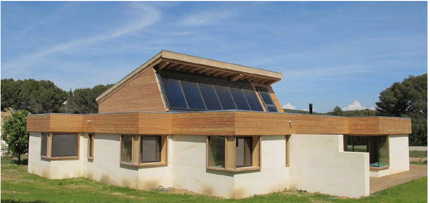
Maison d'habitation en pierre massive à Ventabren.

- Une maison à Ventabren : répondre au programme des commanditaires est complexe. Il a fallu convaincre les clients que la pierre est un bon parti même si ce n'est pas évident. Les propriétaires n'avaient pas forcément des convictions modernes. L'idée de la domus romana en pierre s'est imposée, car l'été il fait chaud. L'agence a relu Vitruve, les classiques elle s'aperçut du travail sur les modules. Des pierres des carrières de Fontvieille ont été utilisées. Un coulis de chaux réalisé. Les murs hydrofugés. Des panneaux solaires et un velux ont été installés. Un poêle est présent comme système de chauffage dans la maison. L'idée était de faire de l'architecture contemporaine mais qui a sa place dans le paysage, dans un dialogue entre intérieur et extérieur. Un escalier hélicoïdal mêlant pierre et bois est en projet. La surface est de 168m 2 , avec 45m 2 de mezzanine. Ce projet a permis de faire les premiers pas dans la construction en pierres massives.