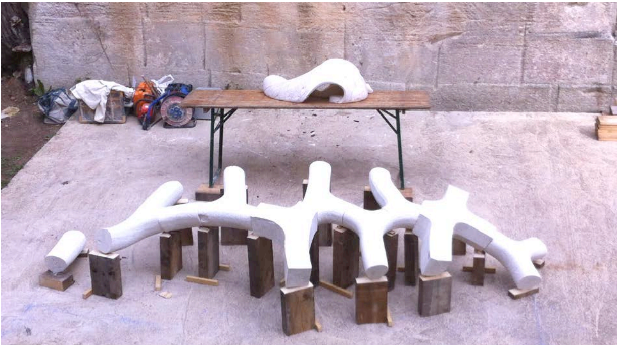
Nervure mise en place lors du Festival de la Pierre des Baux-de-Provence les 20 et 21 septembre 2014.